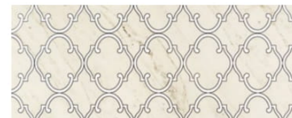
LARDA WHITE dekor ścienny | wall decoration 748 x 298 x 10 mm POLYSK | GLOSS