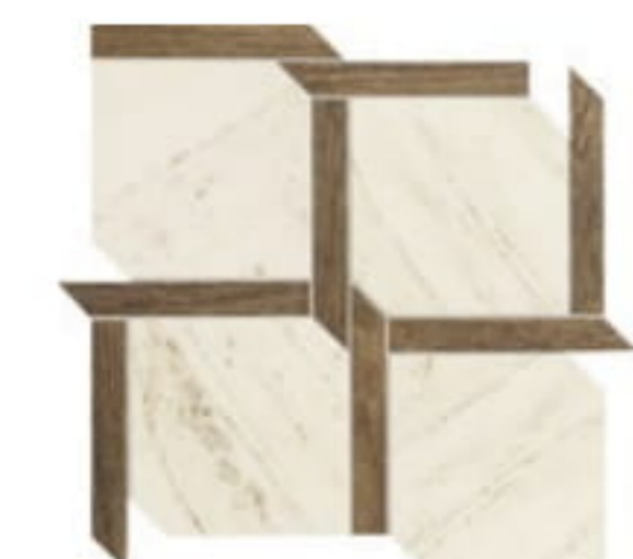
LARDA 1 mozaika gresowa | gres mosaic 346 x 346 x 11,5 mm MAT+POLYSK | MATT+GLOSS