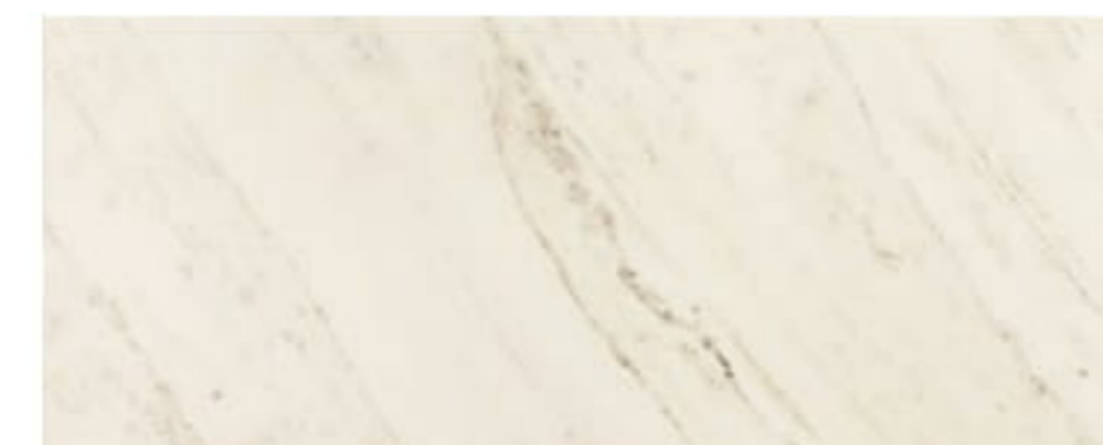
LARDA WHITE płytki ścienna | wall tile 748 x 298 x 10 mm POLYSK | GLOSS