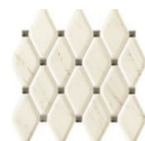
LARDA 1 mozaika ścienna | wall mosaic 298 x 270 x 11,5 mm POLYSK | GLOSS