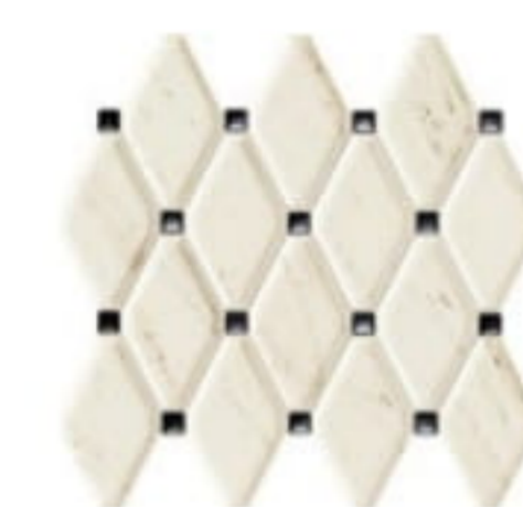
LARDA 2 mozaika ścienna | wall mosaic 298 x 270 x 11,5 mm POLYSK | GLOSS